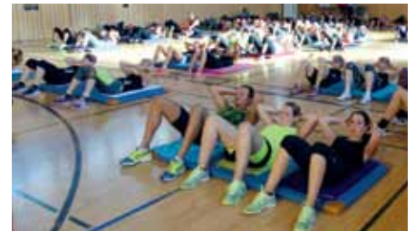
Smart.abs: Gemeinsam ist das Bauchmuskelttraining leichter.