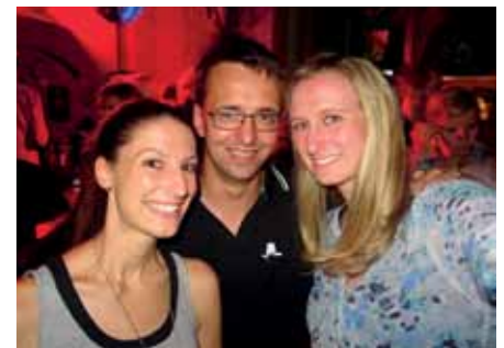
In der Linzer Alm