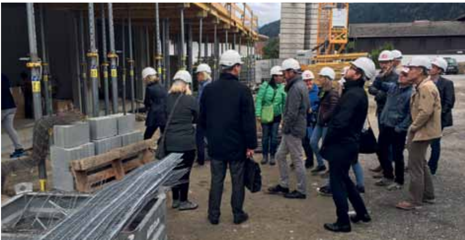
Am 14.10.2016 besichtigte der Gemeinderat den beeindruckenden Rohbau des neuen Kindergartens am Standort Mailweg.