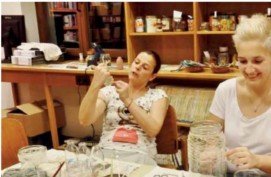
Geduld ist hier gefragt.

@ Homepage: http://www.buecherei-axams.blogspot.co.at