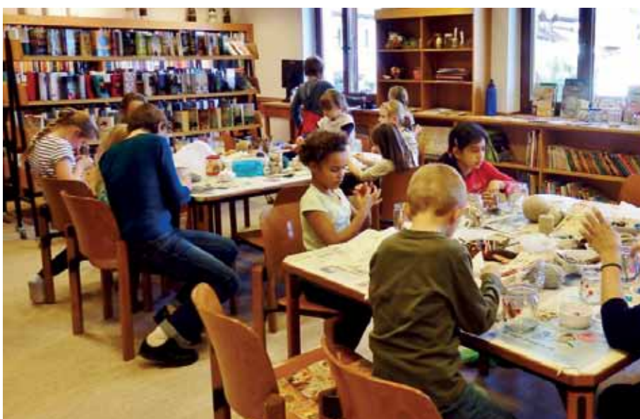
Die Kinder waren konzentriert bei der Arbeit.