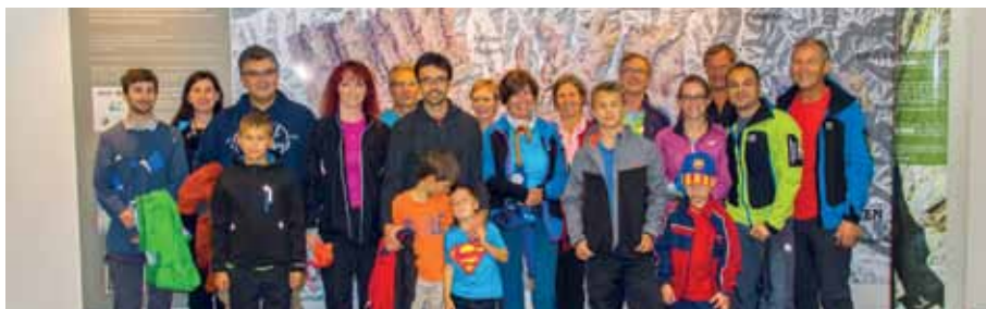
Die Mitgereisten waren vom Museum begeistert.