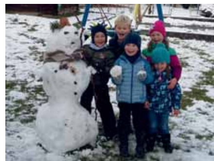
Voller Stolz präsentieren unsere Kinder ihren coolen Schneemann...