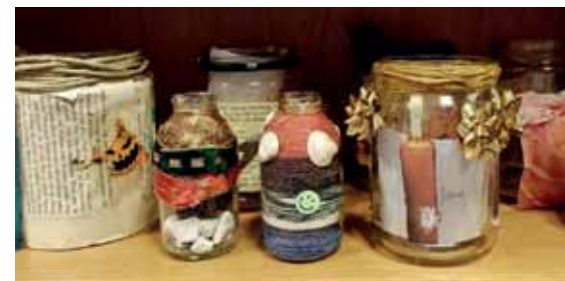
Die ersten Kunstwerke