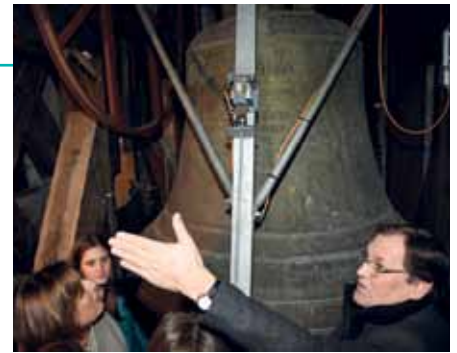
Der Pfarrer erklärt die Kirchenglocke.