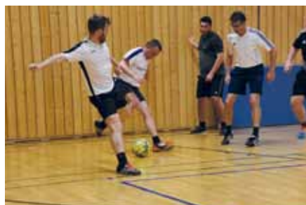
Seit November „zaubern“ die Dornacher beim beliebten Hallentraining.