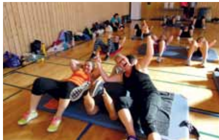
Caro und Gitti hatten sichtlich Spaß!

@ Vereinshomepage: www.taebo-tigers-tirol.at