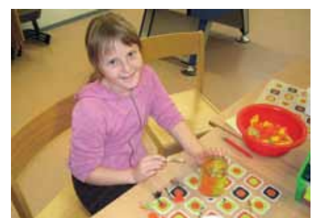
Basteln während der Adventszeit