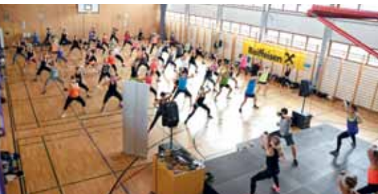
Tolle Stimmung bei vollem Haus