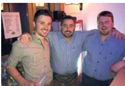
Beste Stimmung: Erfolgreicher Schützenball im Adelshof