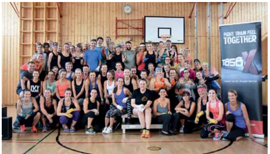
Rund 70 Sportbegeisterte waren beim Special dabei.