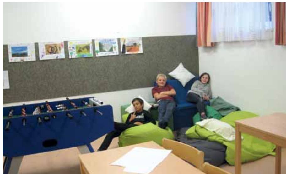
Die Schüler genießen die „Chill-Zone“.