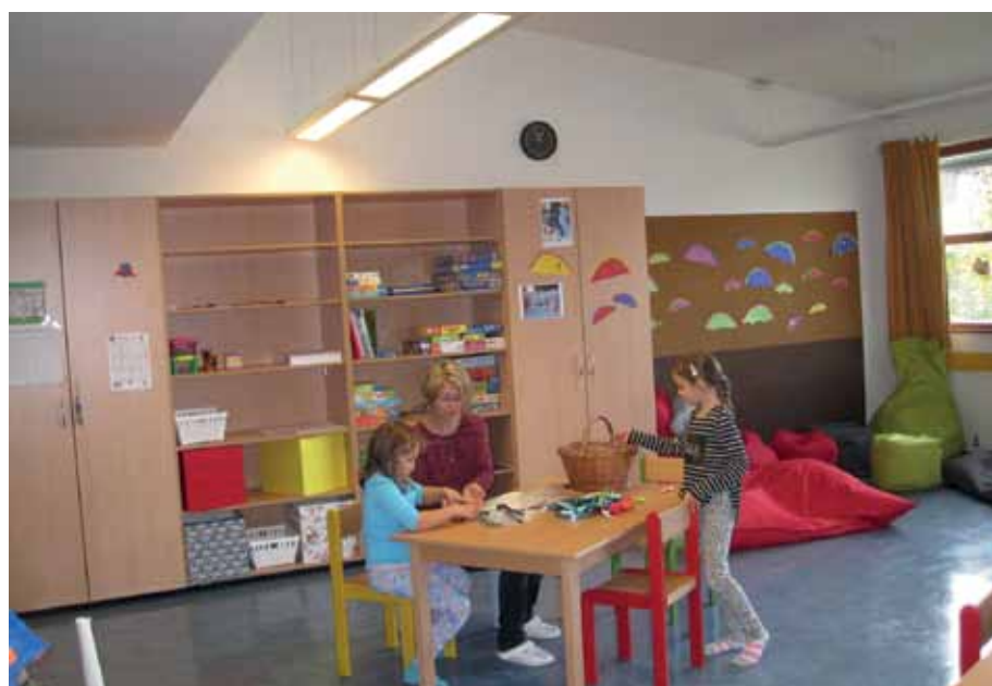
Der Mittagstisch als weiteres Betreuungsangebot