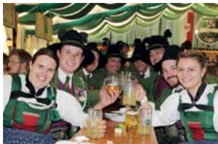
Gauderfest: Das gesellige Beisammensein kam nicht zu kurz!