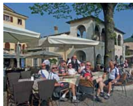
Nachbesprechung in Garda

Sollte Interesse an einer Mitgliedschaft geweckt worden sein, bitte ein E-Mail an radclub.axams@gmail.com senden. Es kann auch ein Programm über die Jahresaktivitäten angefordert werden.