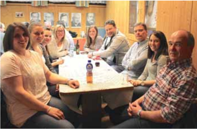
Bereits zum 3. Mal luden die Marketenderinnen des Bataillons Sonnenburg zum Marketenderinnen-Schießen – heuer fand der Bewerb in Götzens statt: Die beiden Axamer Teams landeten auf Platz 8 und 14, während die Sistranser Damen bereits zum dritten Mal in Folge siegten! Die beiden Axamer Damen-Mannschaften vor der Preisverteilung: alle sechs Marketenderinnen mit der Kompanieführung der Axamer Schützen.