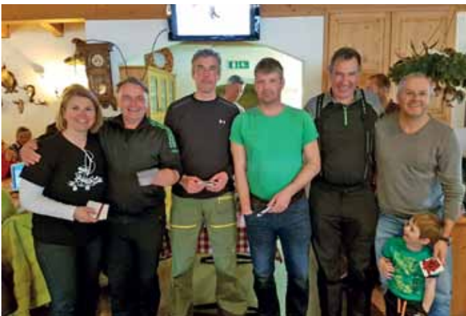
Sieger der Mannschaftswertung – FSK Omes und FC Dornach