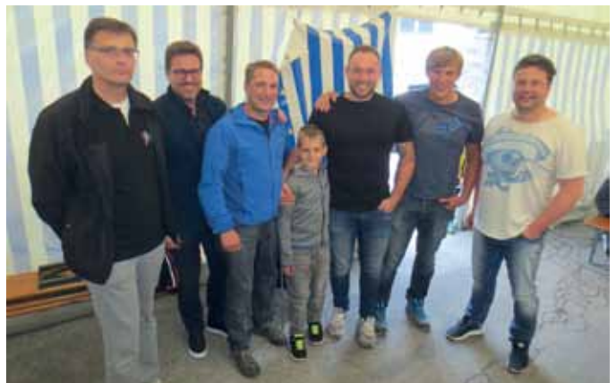
Das Siegerteam mit 551,0 Ringen: Fasnachtsverein Axams mit der Kompanieführung