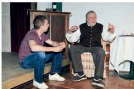
Toni hört den Erzählungen vom Opa gespannt zu

„Sonnwendtag“ wurde erstmals 1902 im Hofburgtheater in Wien uraufgeführt. Dieses Stück hat uns sehr inspiriert und somit haben wir uns mit einer kleineren Spieleranzahl und einigen selbstentworfenen Passagen an die Inszenierung herangewagt.