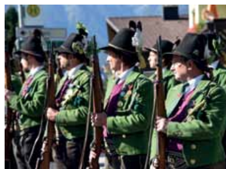
Insgesamt rückten 65 Axamer Schützen und Marketenderinnen in Grinzens aus!