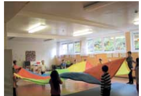
Kinder beim gemeinsamen Spiel