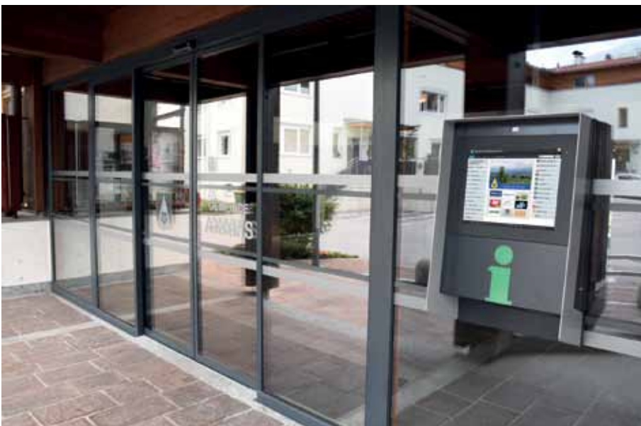
Der neue Haupteingangsbereich – Schiebetüre mit Info-Point: Die Gemeinde Axams bedankt sich bei allen Firmen, die beim Projekt „Gemeindeausstellung Axams“ mitmachen.