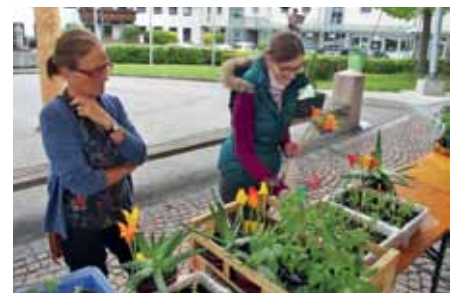
Neben Tomaten werden auch Aloe und Physalis angeboten