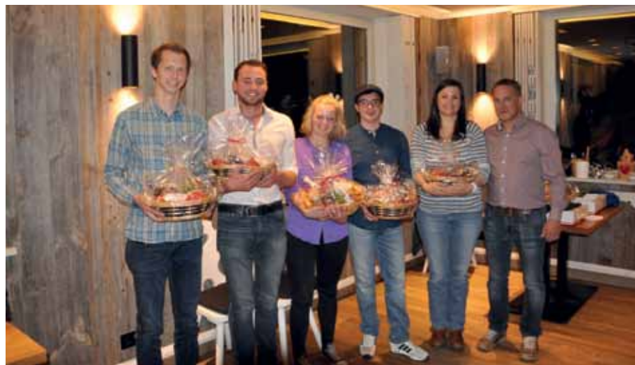
Dank, Anerkennung und Geschenke für die ausgeschiedenen Fax-Ausschuss-Mitglieder