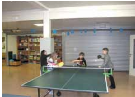
Kinder beim Tischtennispielen