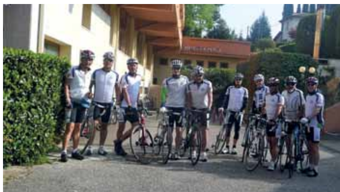
Vor der ersten Ausfahrt am Hotel-Parkplatz