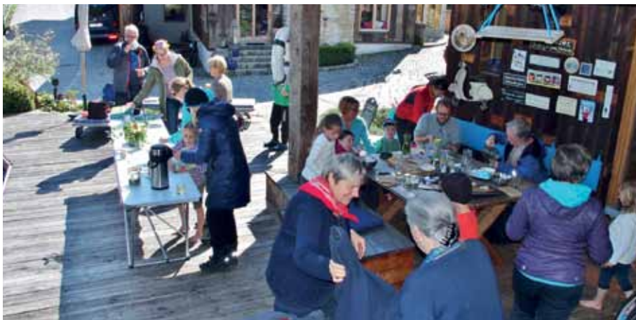
Die gesammelten Kräuter werden sichtlich genossen

Gestärkt und mit vielen Eindrücken und Gaumenüberraschungen, wurden die Teilnehmer mit neuen Ideen zum Selbermachen nach Hause entlassen.