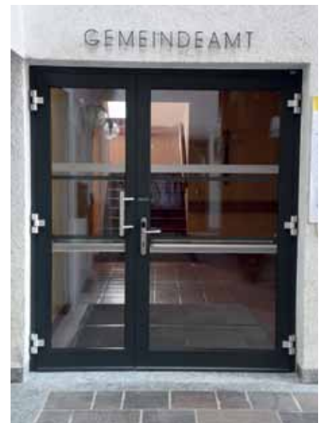
Die neue Eingangstüre vom Foyer ins Gemeindeamt