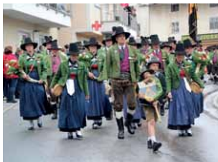
Schneidiges Ausrücken im Zillertal: Eine starke Abordnung der Axamer Schützen!

Platter „seine“ Axamer auf der Tribüne an. Im Festzelt konnte dann auf einen gelungenen Axamer Ausrückungsstart des heurigen Jahres angestoßen werden.