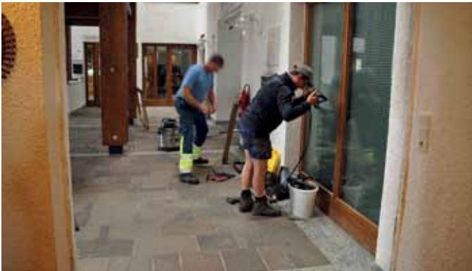
Die Demontage der alten Türen erfolgte durch die Gemeindearbeiter