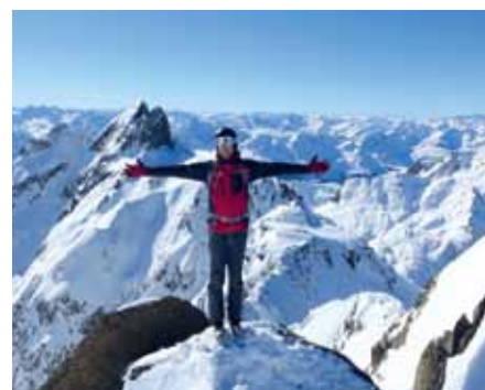
Klaus präsentiert die Vorarlberger Bergwelt