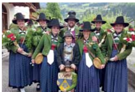
Begehrtes Fotomotiv waren alle Axamer Schützenmarketenderinnen!