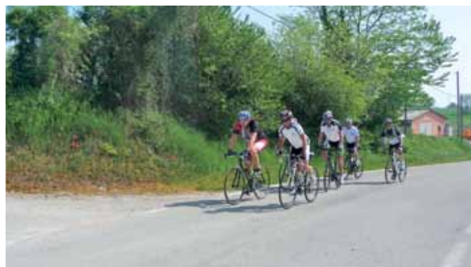
An Mohn und Salbei vorbei nach Solferino