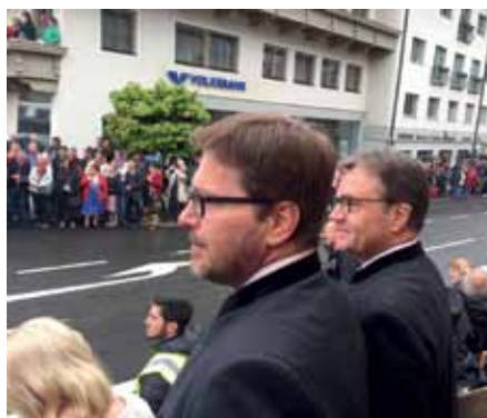
Feuerten die Axamer Abordnungen von der Ehrentribüne aus an: Bürgermeister Christian Abenthung und Landeshauptmann Günther Platter