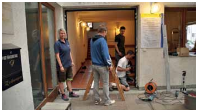
Einbau der Eingangstür