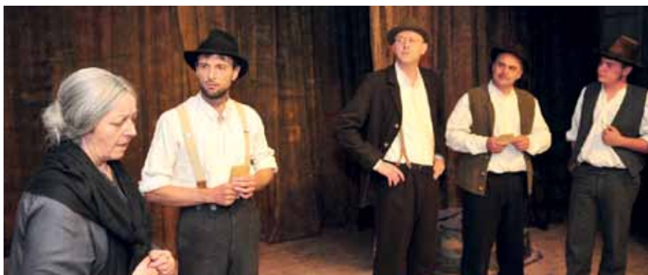
Der Gemeinderat erpresst die Rofner's

Auch wenn das etwas abgeänderte Stück nicht ganz originalgetreu nachgespielt wird, so tut dies dem Sinn des Inhaltes keinen Abbruch. „Schönherr-Kennern“ wird auffallen, dass jedes seiner Stücke, auch wenn sie bereits in die Jahre gekommen sind, immer noch allgegenwärtige Situationen und Lebenslagen wiederspiegeln.