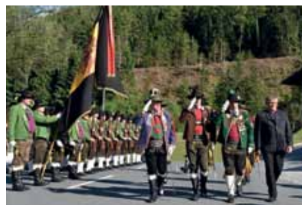
60-Jahr-Feier der Schützenkompanie Grinzens: Ehrenformation aus Axams beim Abschreiten der Front