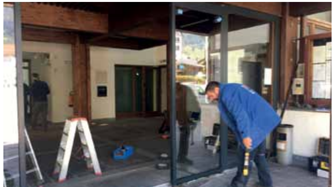
Montage der Schiebetür