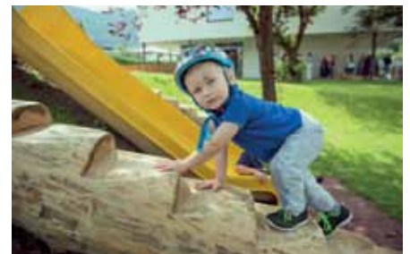
Action und Spaß sind garantiert!