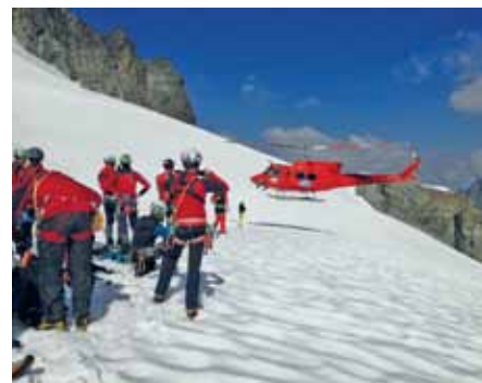
Übungsflüge am Tau

Axamer Lizum, wo der TT-Wandercup ebenfalls von der Bergrettung Axams betreut werden musste. Und so rückten 7 Bergretter der Ortsstelle Axams nach dem Arbeitsdienst am Dorfplatz in die Lizum ab, um dort bis 17.00 Uhr für die Sicherheit der mehr als 1.400 Teilnehmer zu sorgen.