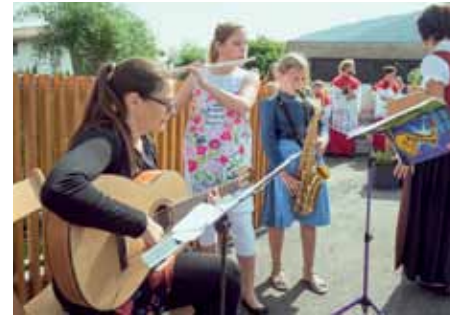
Kinder vom Kinderchor beim Schlusslied