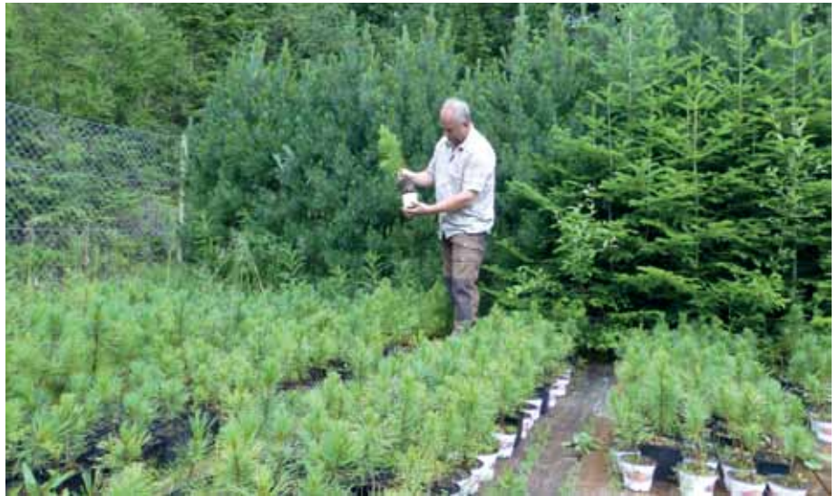
Qualitätskontrolle durch Waldaufseher