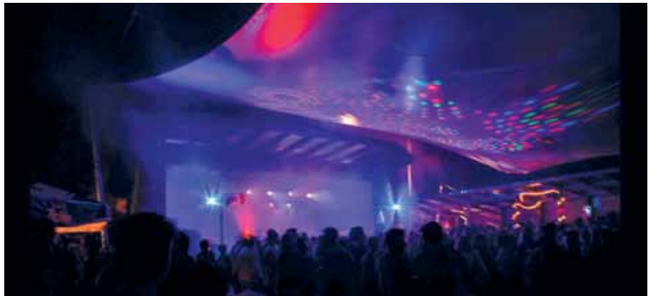
Wieder einmal tolles Ambiente am Pavillon beim Dorffest