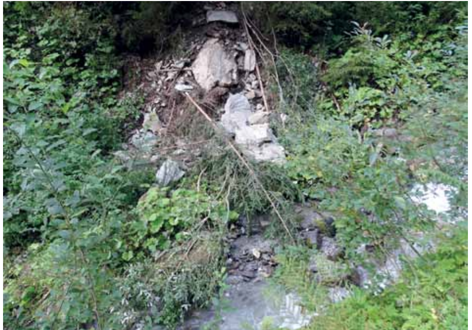
Felssturz in den Bach – Axamer Tal