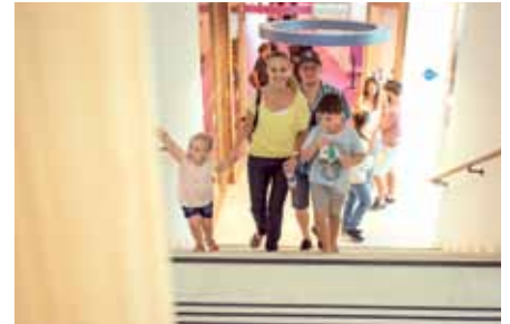
Für die Bevölkerung gab es die Möglichkeit zur Besichtigung