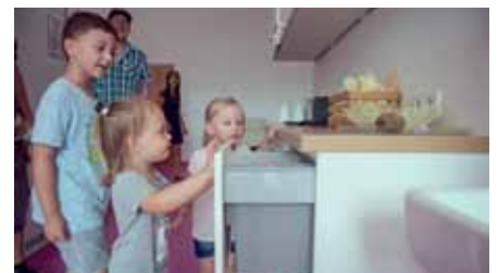
Viel Neues gab's zum Entdecken