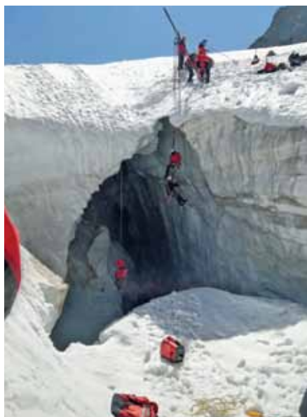
Abseilstation/Spaltenbergeübungen im Jamtal