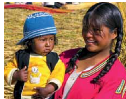
Das Weltladenteam bedankt sich bei allen Besuchern des Weltladens!

Vielen Dank allen, die den Weltladen besuchen, und so wesentlich für eine gerechtere Welt beitragen und der betroffenen Bevölkerung helfen.