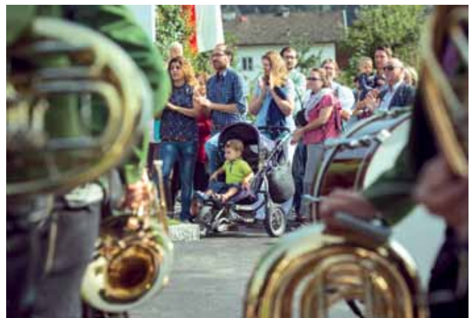
Großen Applaus für den neuen Kindergarten gab es von den zahlreich erschienenen Eltern.